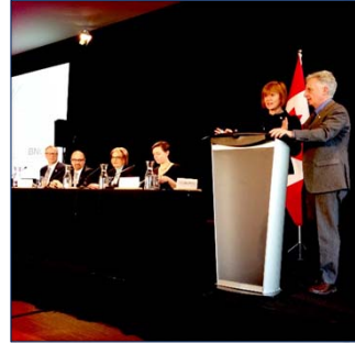
Conférence de presse Toronto, 16 janvier 2014